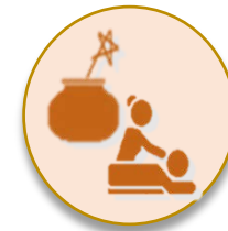
แพทย์แผนไทย

3 การพัฒนาการสื่อสารสาธารณะเพื่อกระตุ้นความต้องการใช้สมุนไพร